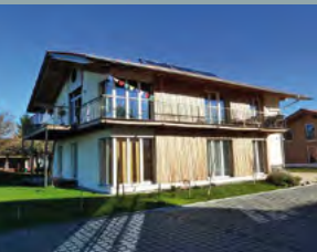
Thum, EFH Chieming, ID 1671 Erlenweg 8 83339 Chieming Öffnungszeiten: 13 – 15 Uhr