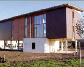
Lebensraum Holz, Bürogebäude Bad Aibling, ID 1112 Gewerbepark Markfeld 15-19 83043 Bad Aibling Öffnungszeiten: 13 – 15 Uhr