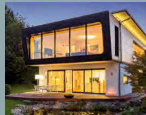
Ambienti+, EFH Seebrück, ID 2602 Regnauer Hausbau, Bauherrenzentrum Pullacher Str. 11 83358 Seebrück Öffnungszeiten: 10 – 18 Uhr