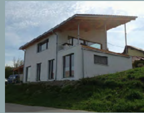
Dolp, EFH Soyen, ID 2922 Kafflberg 15 83564 Soyen Öffnungszeiten: 13 – 15 Uhr