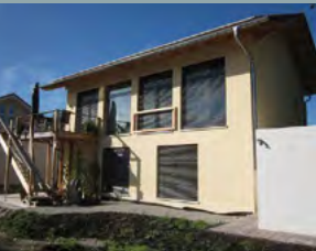
Maluche-Nowak, EFH Großkarolinenfeld, ID 2108 Nelkenweg 24 83109 Großkarolinenfeld Öffnungszeiten: 10 – 12 Uhr