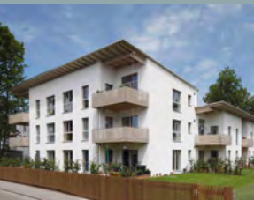
Korbinianspark, MFH Heufeld, ID 2145 Am Korbinianspark 4, 83052 Bruckmühl/Heufeld Öffnungszeiten: 13 – 15 Uhr