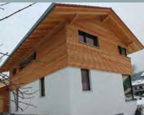
Schütz-Häusermann, EFH Bergen, ID 2363 Türkenbundstr. 4 83346 Bergen Öffnungszeiten: 10 – 12 Uhr