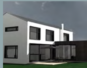
Horn, EFH (im Ausbau) Kiefersfelden, ID 2976 Sonnenweg 20 b 83088 Kiefersfelden Öffnungszeiten: 10 – 12 Uhr

Alle Hausbesichtigungen sind am Sonntag, den 10.11.2013!