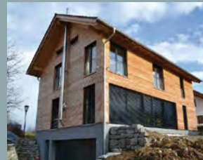
Janhsen, EFH Egmating, ID 2362 Am Ried 34a 85658 Egmating Öffnungszeiten: 14 – 16 Uhr